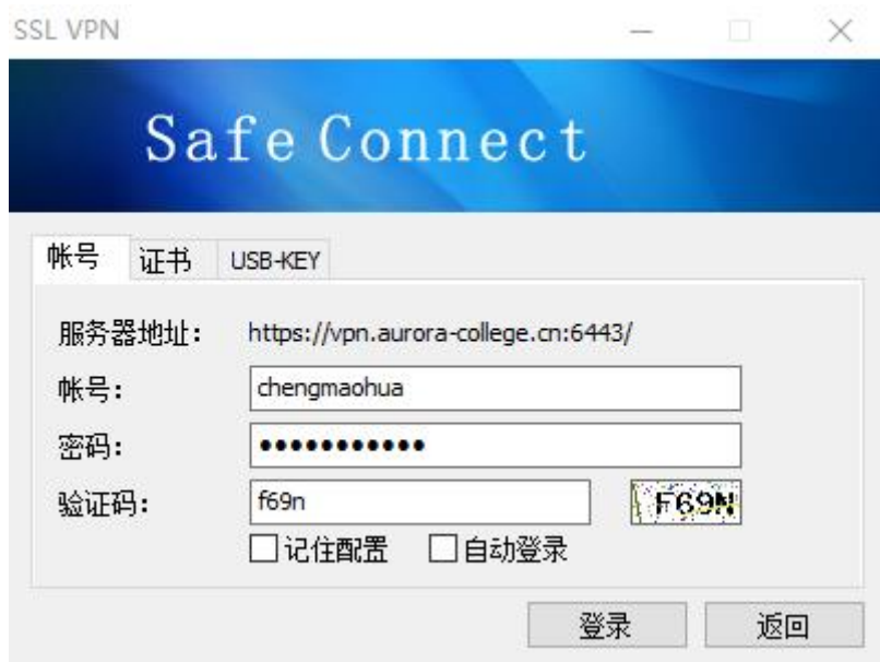
图 7 输入账号、密码对话框

7、在如图 7 所示对话框中输入正确的 账号 、 密码 ，以及 验证码 ，点击“登录”按钮。