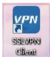
图5 安装完成以后桌面上出现的客户端图标