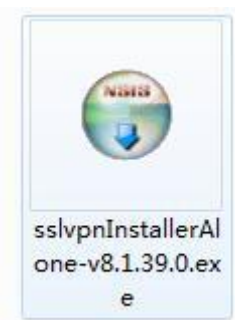
图3 下载下来的客户端安装源文件的图标