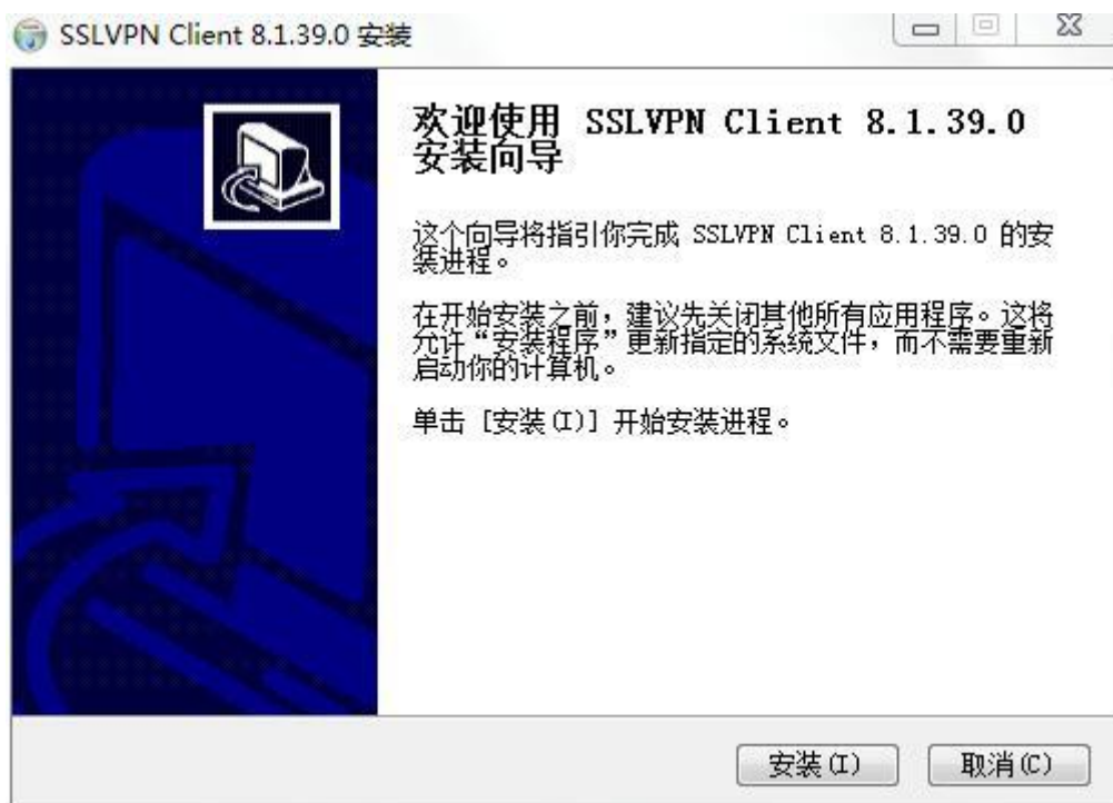
图4 安装下载下来的客户端

特别注意：如果安装过程中，出现安全类提示或警告，请选择“允许”或“确定”，切勿选择“取消”，否则安装会失败。