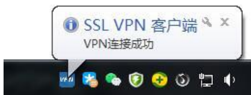
图 8 VPN 连接成功

8、登录成功以后，在任务栏右下角会出现如图 8 所示的“VPN 连接成功”提示，且此时会自动打开浏览器窗口，如图 9 所示。