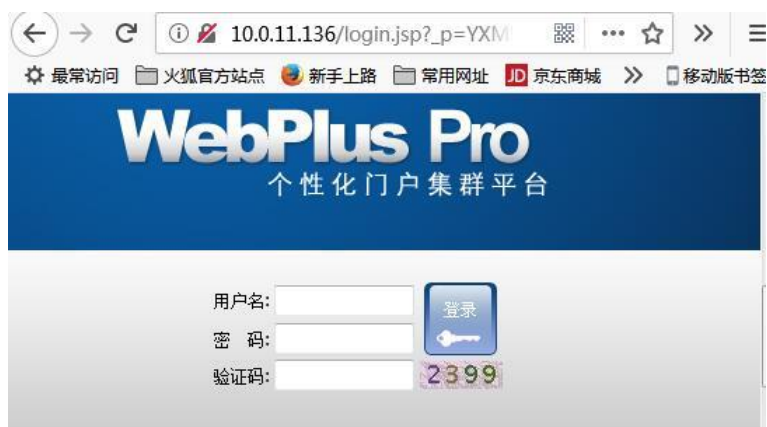
图 12 对特定内网资源进行访问

10、此时就可以像身在学校时一样对特定内网资源进行访问了, 如图 12 所示。（注意: 保持如图 10 所示浏览器窗口打开状态, 不可关闭, 否则就退出 VPN 了）