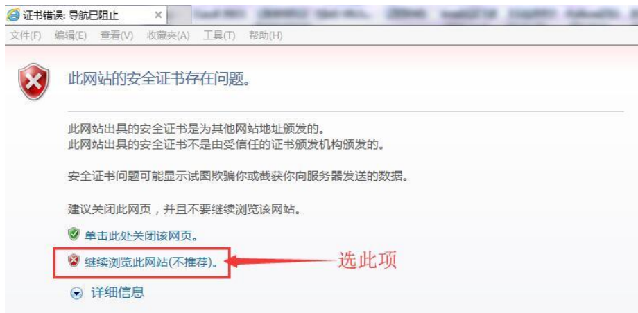
图 9 自动打开的浏览器窗口

9、在如图 9 所示浏览器窗口中, 请选择“继续浏览……”（这是 IE 浏览器的提示, 其他浏览器的提示文字可能略有不同, 以此类推), 打开如图 10 所示“可用资源列表及欢迎”界面（注意: 该浏览器窗口不可以关闭, 否则就退出 VPN 了）。