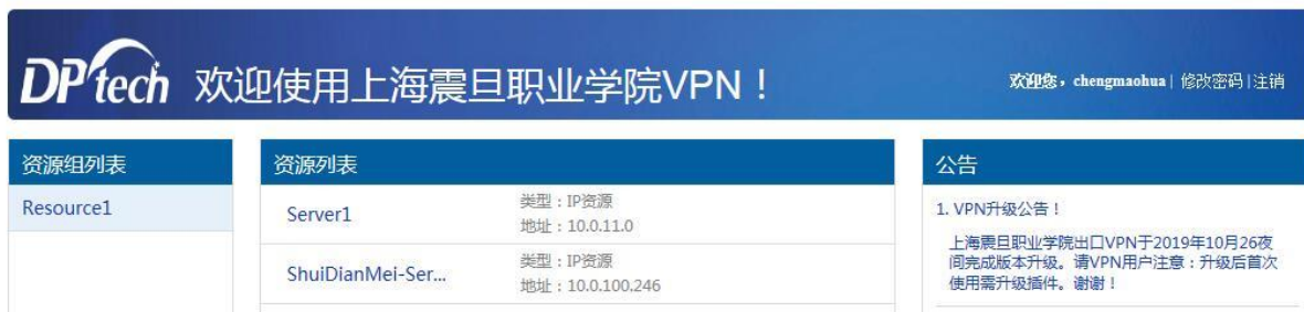
图 10 “可用资源列表及欢迎”界面

9、在如图 9 所示浏览器窗口中, 请选择“继续浏览……”（这是 IE 浏览器的提示, 其他浏览器的提示文字可能略有不同, 以此类推), 打开如图 10 所示“可用资源列表及欢迎”界面（注意: 该浏览器窗口不可以关闭, 否则就退出 VPN 了）。