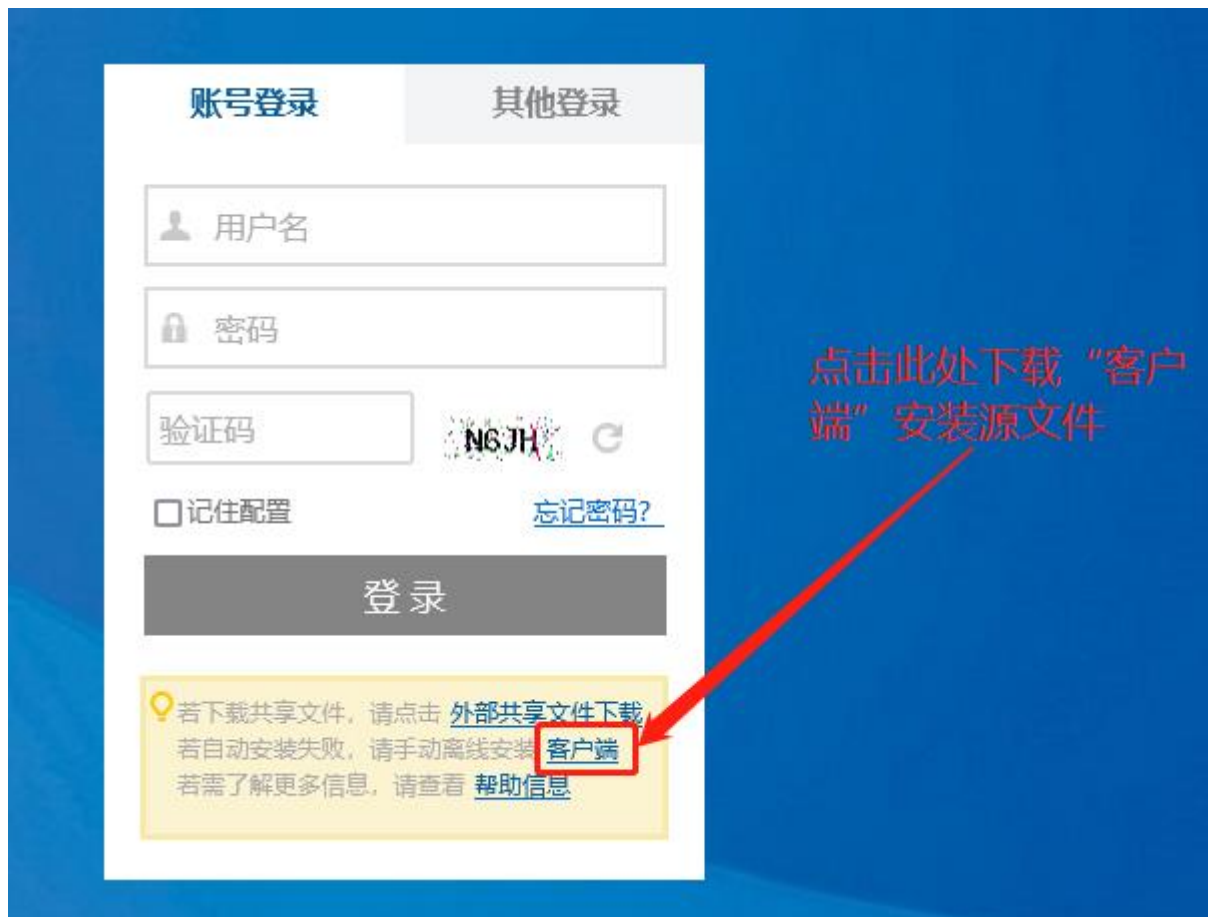
图 2 VPN 登录界面